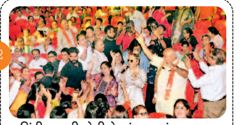
सिंधी अबाणी बोली के मंच पर गूजा दमा...